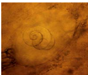
Trichinella spiralis – ларва в напречно набраздена мускулатура

Причинители на заболяването са малки кръгли червеи – трихинели. В България се откриват 2 трихинелни вида – T. spiralis , при епидемични взривове от домашни свине и T. britovi , свързана по-често с взривове от диви животни.